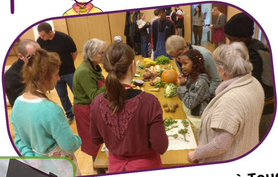
A la Halle aux grains à Toucy