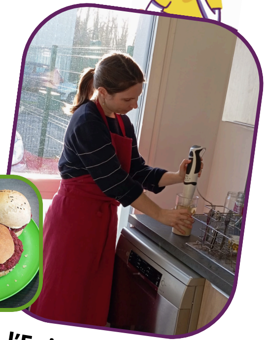
A l'Épicerie Solidaire de l'Auxerrois